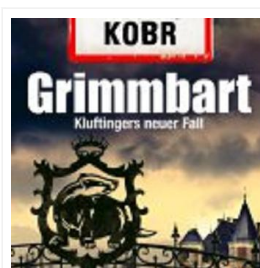
Grimmbart: Kluftingers neuer